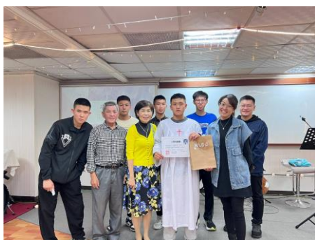
左圖是預校生在教會受洗後的合影，求神祝福未來軍人生涯。