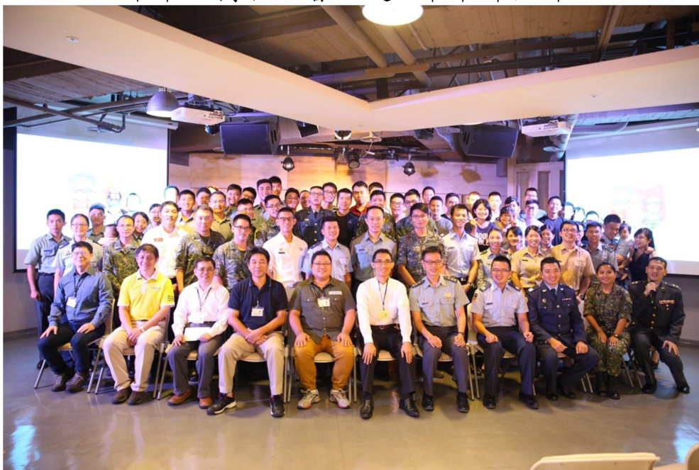
107年第八屆軍人禱告大會全體合照(有著軍服的)